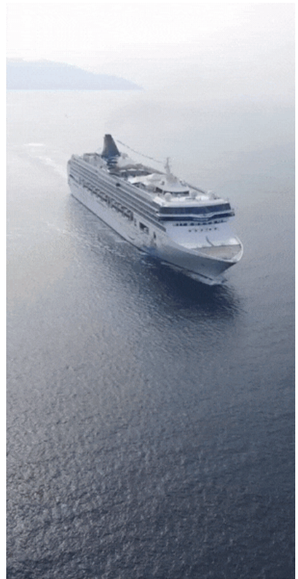
Rod Stewart – Sailing

ΟΛΟ Α.Ε.: Οικονομικά Αποτελέσματα 2020 →